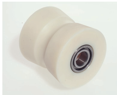
TECAST T - Puleggia